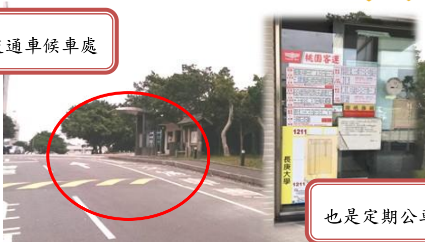
也是定期公車候車處