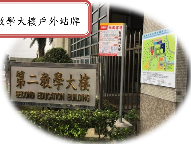
第二教學大樓戶外站牌